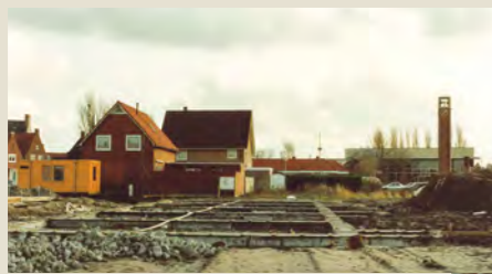
▼ De symbolische eerste paal wordt geslagen voor de nieuwbouw van 10 appartementen aan de Sportlaan, op de locatie van de voormalige Sint Nicolaasschool en Sint Lidwinaschool.