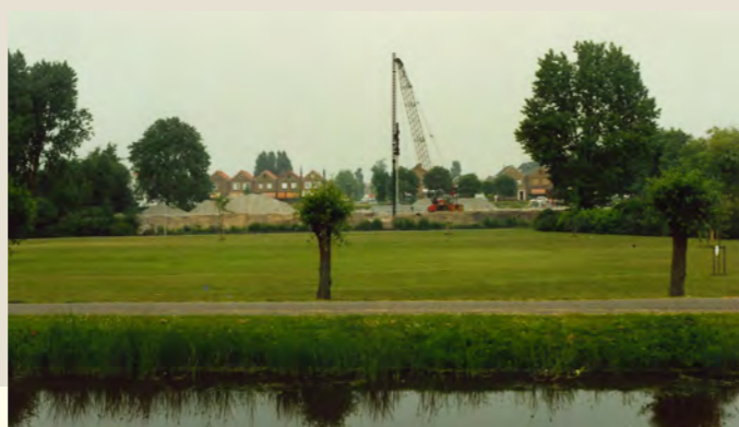
▼ De symbolische eerste paal werd geslagen ter ere van de nieuwbouw van 32 seniorenappartementen en een recreatieruimte aan de Tulpenstraat, op de locatie van de voormalige Tarcisiusschool.