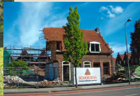
▲▼ In 2011-2012 realiseerde De Vooruitgang aan de Julianaweg en de Kielstraat 85 seniorenappartementen, een recreatieruimte en een parkeergarage voor ongeveer 120 voertuigen. Voorheen stonden hier 39 eengezinswoningen.