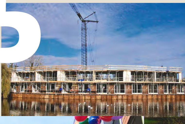
Naast deze appartementen werden in 2006 nog 10 waterbungalows gerealiseerd. Deze seniorenwoningen achter de Rozenstraat (nu Meerzicht) zijn gelijk na oplevering verkocht.