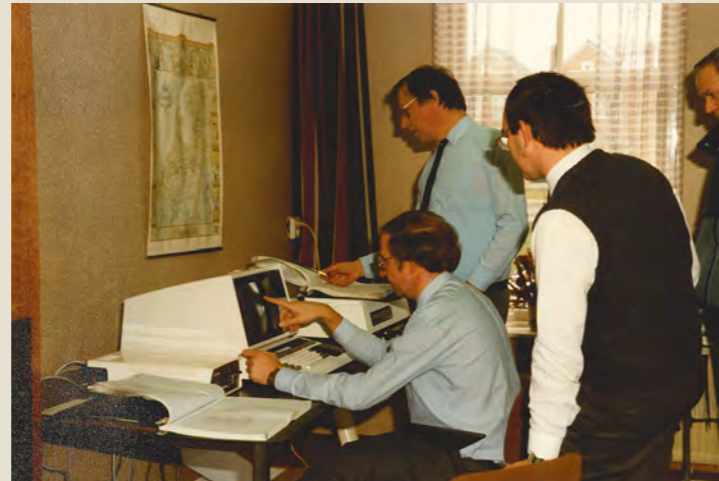
▲ Van contant per week aan de deur tot geautomatiseerde huurincasso per maand. In de jaren '80 volgden medewerkers van De Vooruitgang diverse computer-cursussen i.v.m. het digitaliseren van huurbetalingen. Later volgden cursussen m.b.t. waarborgsommen, huursubsidie en huurmatiging. Al snel werd een geschat bedrag van 25.000 tot 30.000 euro terugverdiend. Overigens was het merendeel van de huurders tegen het automatisch incasseren van de huur.