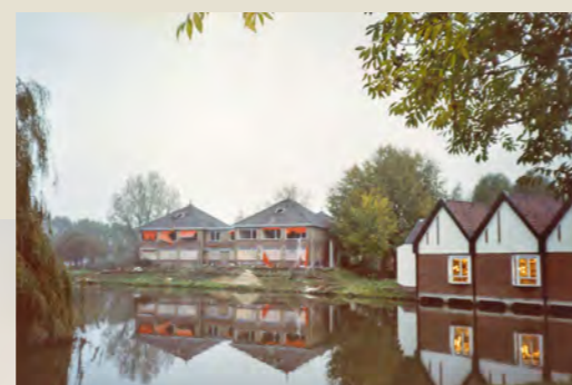
▼ In 2002 werden 20 duplexwoningen uit 1950 aan de Roerstraat gesloopt, om in 2005 plaats te maken voor nieuwbouw: 24 woningen, verdeeld over twee woonlagen.