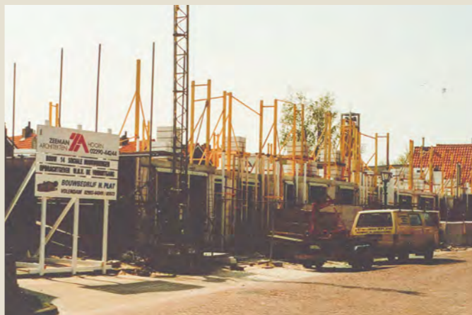
▲ Nieuwbouw van 3 eengezinswoningen aan de Prins Bernhardlaan en 14 appartementen aan de Prins Bernhardlaan en het Professor Klaas Steurplantsoen, op de locatie van de WALA-fabriek.