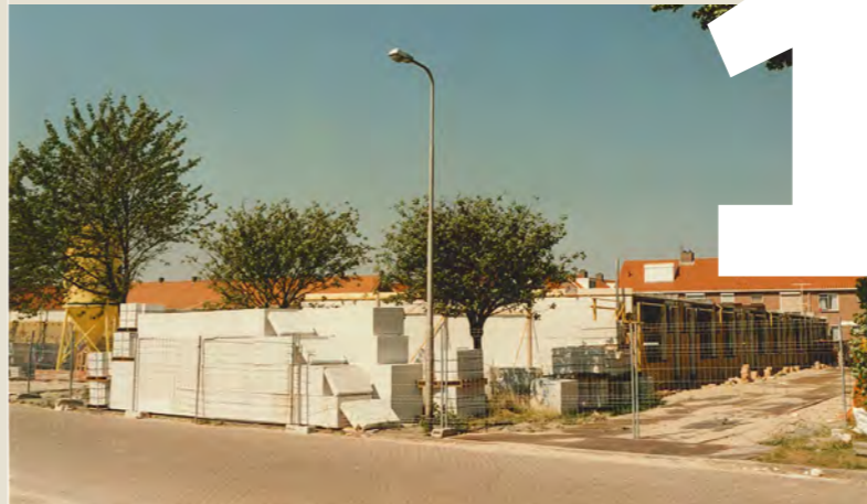
◀ Nieuwbouw 32 appartementen aan de Henegouwen, op de locatie van de voormalige Levensschool.